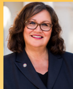
캐티 무리요 하원 선거구 37