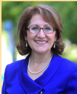
엘로이스 고메즈 레예즈 하원 선거구 47