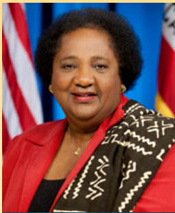
셜리 웨버 하원 선거구 79