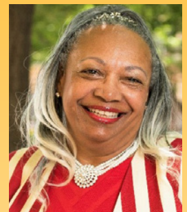
데니안트와네트 마칭고 하원 선거구 42