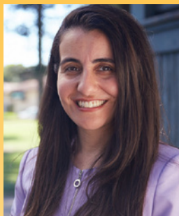
모니크 리슨 상원 선거구 19

모든 캘리포니아 주민들을 기후 위기로 부터 보호하려면 다음과 같은 방면에서 의미있는 동반자가 될 수 있는 환경 정의 챔피언들이 선출 되어야 합니다. 3월 3일, 다음과 같은 후보자들에게 투표해 주십시오: